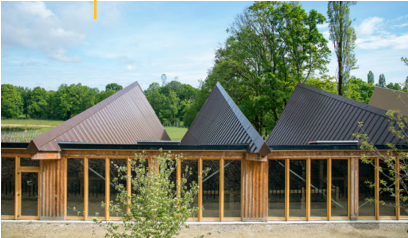
Parc de Branféré, 56190 LE GUERNO