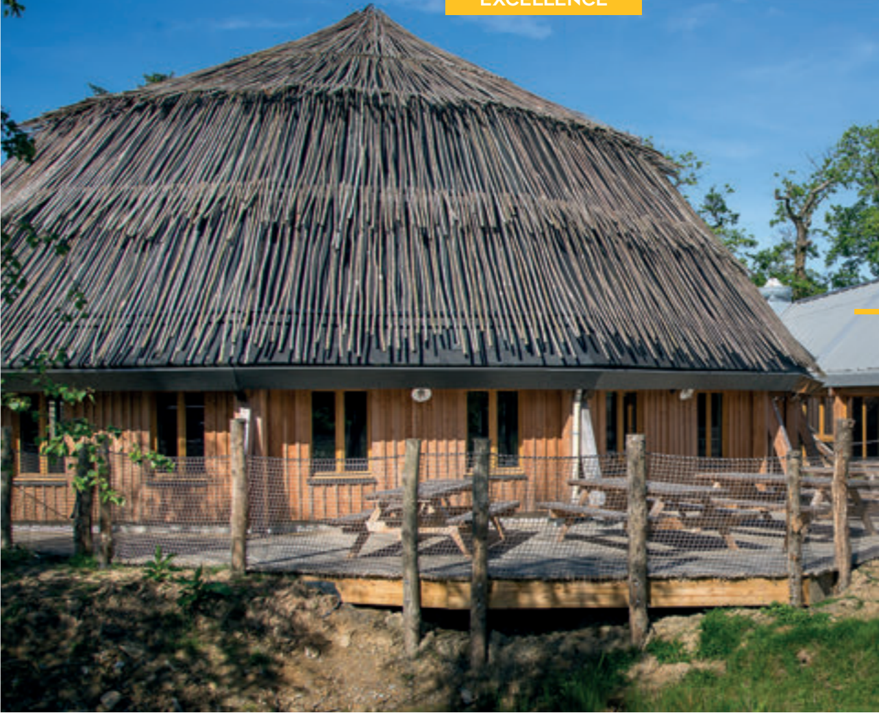
Parc de Branféré, 56190 LE GUERNO